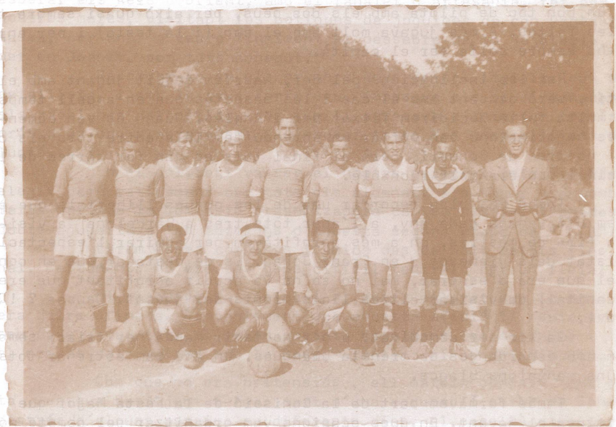
El C.F. Bonmatí l'any 1942. En la foto hi podem veure 10 ex-alumnes.