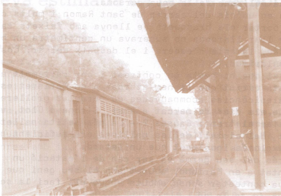
L'estació, les vies i el tren varen ser la vida d'en Marianet.