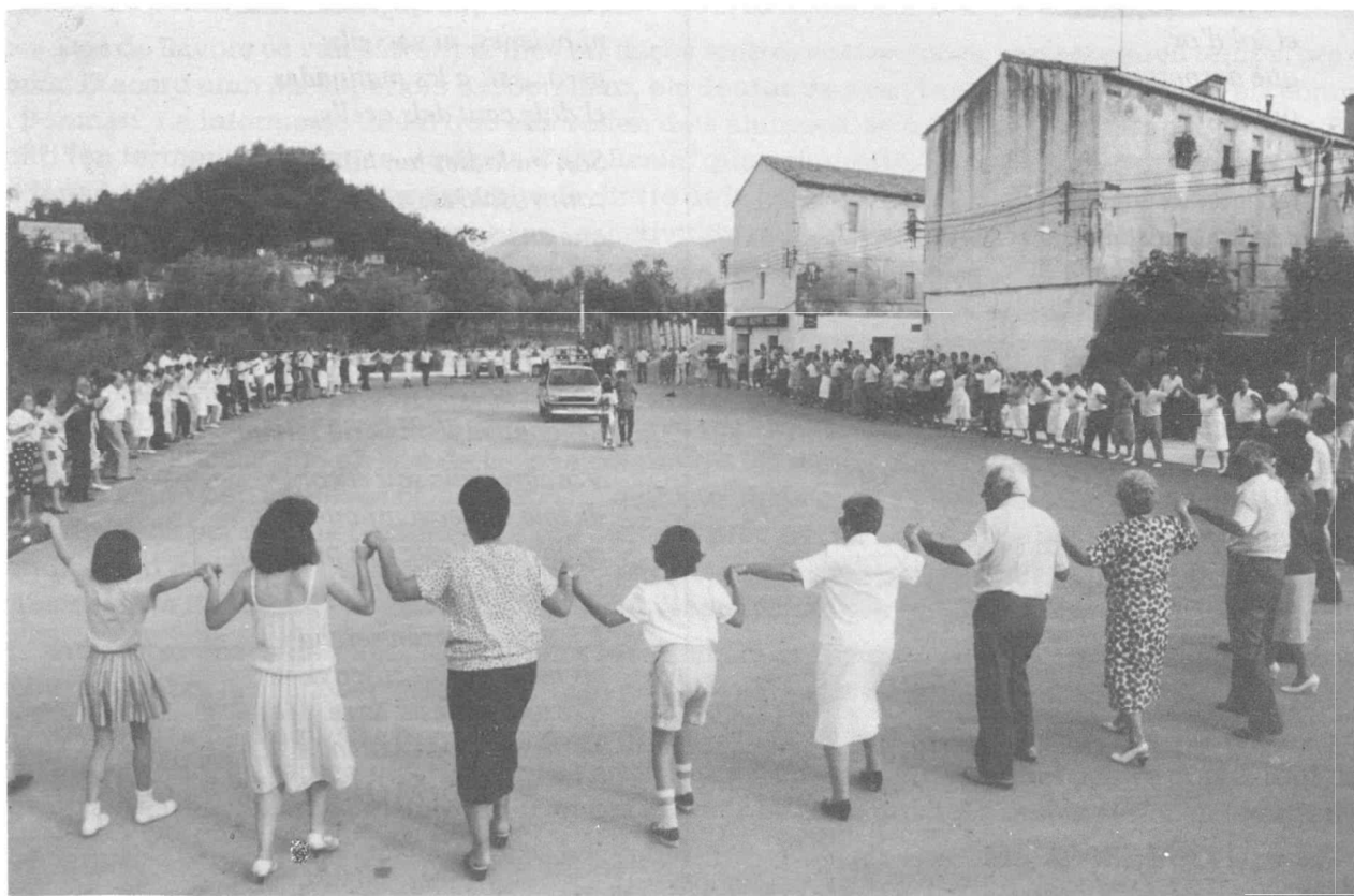
Que un cop ballada la sardana de germanor, tots tinguem un any de menys.