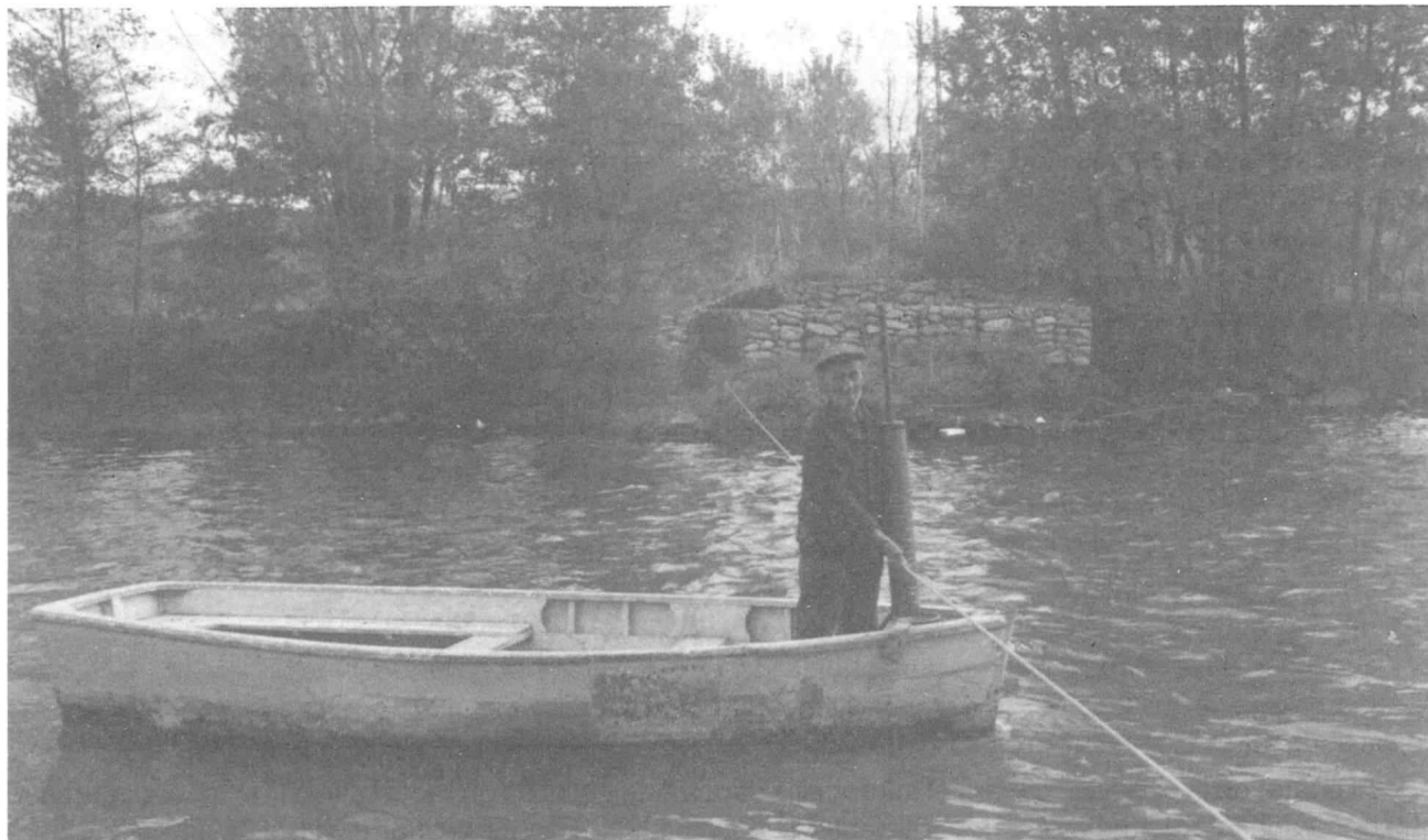
L'avi del "Restaurant la Barca". Quatre generacions d'aquesta família han sigut els barquers.

morava el Roser. No cal pas dir que la més important era l'última, ara la Festa Major que es continua celebrant en honor de Sant Agustí. Era el 28 d'agost i en alguna ocasió, davant les discrepàncies que hi havia entre els veïnats dels carrers Petit i Nou amb el Vell, s'havien organitzat dues festes, i com era d'esperar van acabar amb discòrdies i força malament.