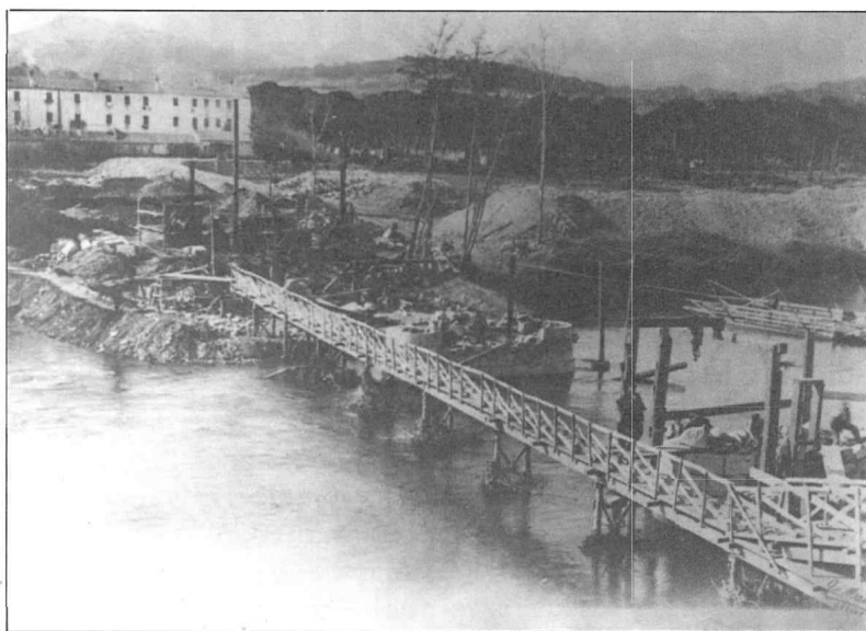
Les transparents aigües del Ter a començaments de segle, al seu pas per Bonmatí, quan el riu no coneixia la contaminació.