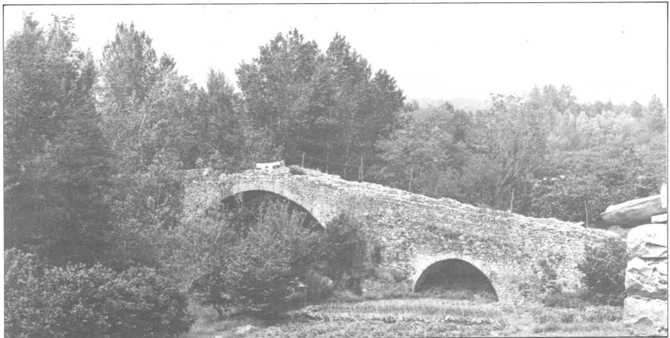
El pont romànic de Sant Julià, prop del carrer Vell.

Més tard era carregat a Bonmatí quan va sorgir el tren d'Olot. Finalment un cop fundada la colònia, en la coneguda actualment plaça del motor, s'hi aixeca un molí per triturar la barita extreta de les mines.